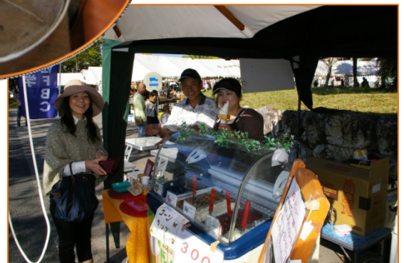
全部美味しそうで目移りします☆