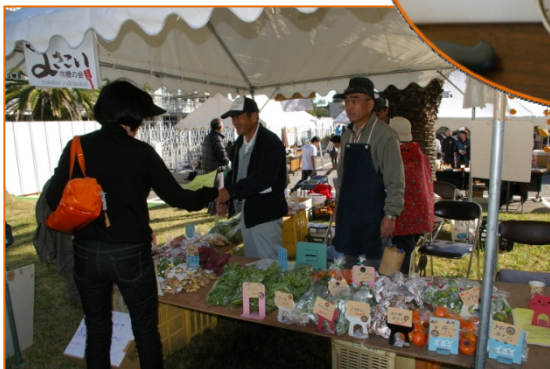
新鮮な野菜が揃ってます!