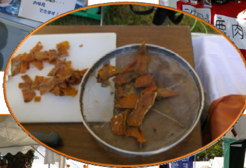
干しいもアンケートへのご協力 ありがとうございます