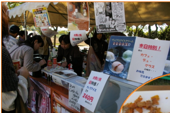
「こちらがオススメですよ～」