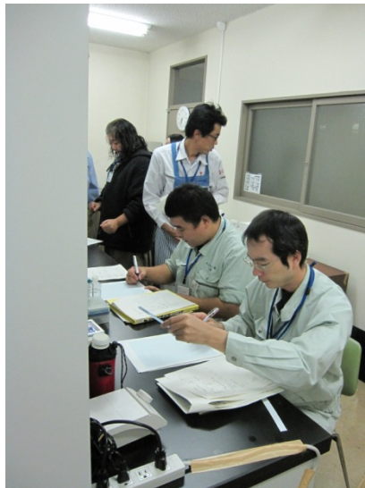
計測したものを ノートにまとめます