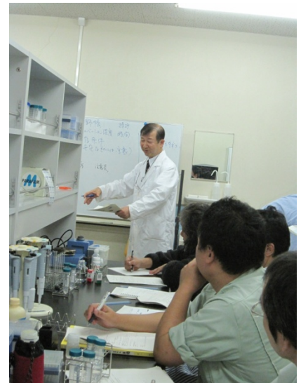
グラフを描いたら 数値を読み取っていきます