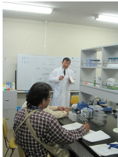
重要なところはしっかりメモ！