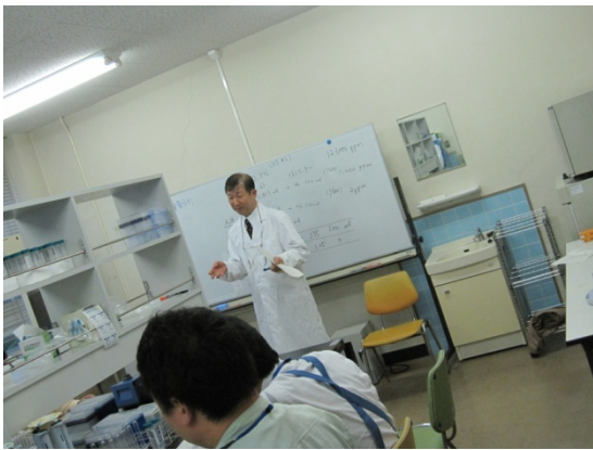
実験に入る前に講義を受けます