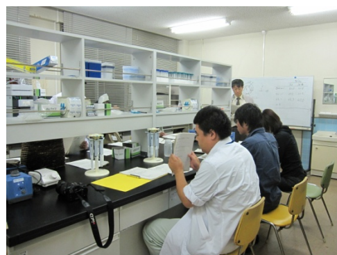
最後に、実験結果について説明を受けました