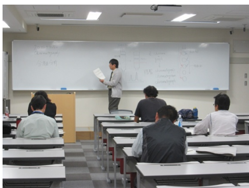
実験に入る前に講義を受けます

今回は高速液体クロマトグラフィー (HPLC) による食品成分の分析を行いました。試料として柑橘類を使用したのですが、実験室にはさわやかな香りが漂いました。細かい作業や難しい計算が続いて大変でしたが、最後まで熱心に取り組む姿がとても印象的でした。