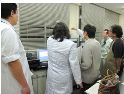
使い終わったHPLCの停止作業中