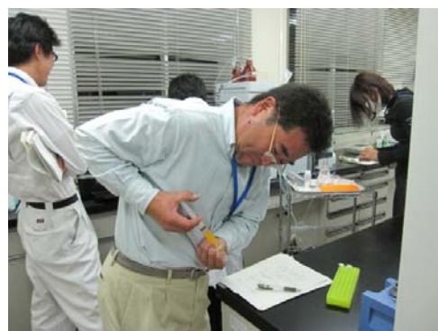
果汁のろ過をしています