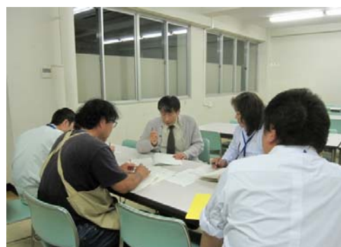
実験の結果について考察します