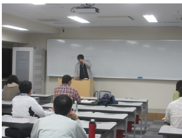
初めにHPLCとの違いを学びます

前回の高速液体クロマトグラフィーに続き、今回はガスクロマトグラフィーについて学びました。農学部生物資源利用化学研究室をお借りして、焼酎に含まれるアルコール含量の測定を行いました。慣れない作業に戸惑いながらも、各自でデータを収集し、分析を行いました。