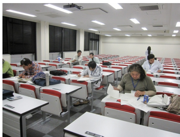
集めたデータを基に計算します