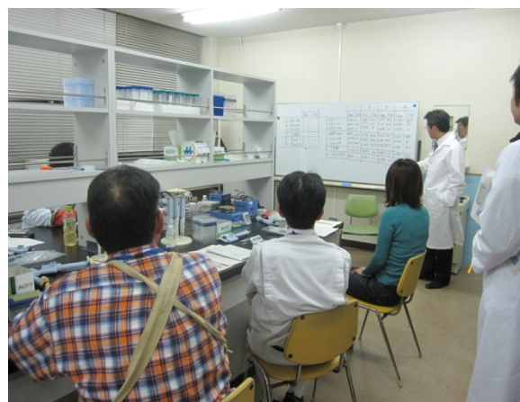
測定結果について考察しました