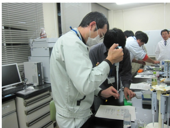
少量の試料を注意深く入れていきます

今回は、食品機能解析法を学びました。様々な食品の抗酸化能や、食品に含まれる血圧上昇抑制作用を評価したりしました。8連ピペッターや96穴プレートなど、初めて使う道具も多かったので、時間をかけてじっくり取り組みました。