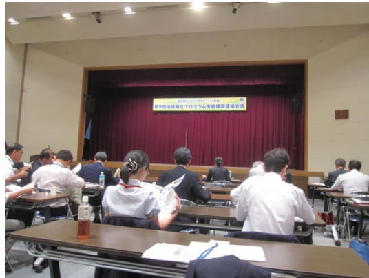
実施機関連絡会議

1日の実施機関連絡会議では、科学技術戦略推進費・地域再生人材創出拠点の形成プログラム53機関が一堂に会し、進捗状況やプロジェクト終了後の事業継続に関して意見交換を行いました。また、JST清水プログラムオフィサーによる進捗状況報告において、土佐FBCの取り組みがGood practiceとして紹介されました。