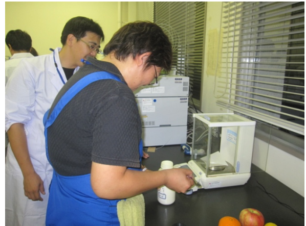
分析天秤で微量の塩化ナトリウムを量ります