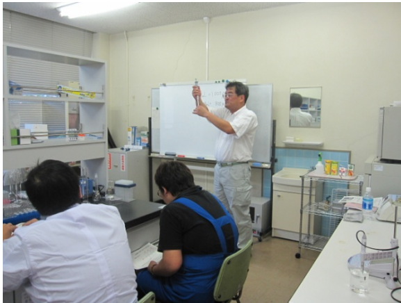
オートピペッターの使用法を説明しています

どちらの回も計算の時間がありましたが、久しぶりの数学に苦労された方も多かったようです。