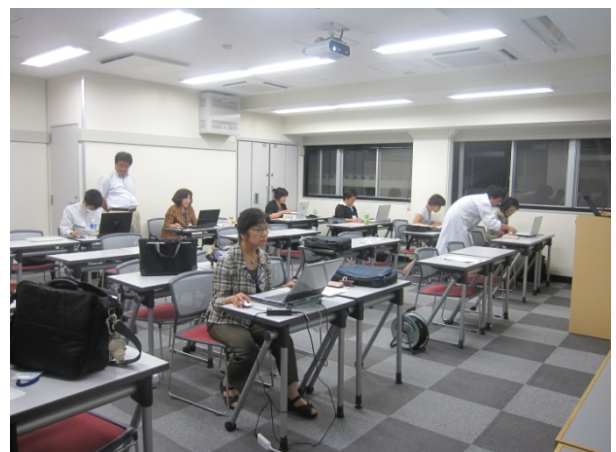
統計解析中！ 操作法も計算も難しい☆