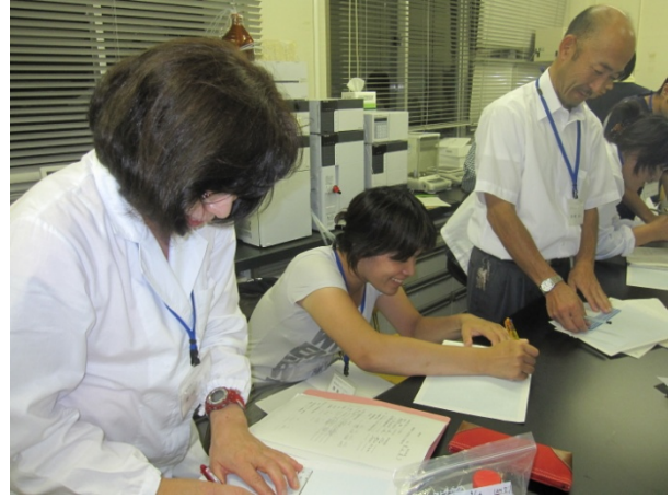
グラフを描いたら 数値を読み取っていきます