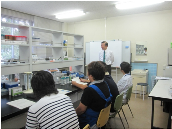
実験に入る前に講義を受けます

今回は試水に含まれる残留塩素の測定を行いました。 各自、一種類以上の試水を採取してきてもらい、残留塩素を測定しました。 キットを使って目で測ったり(比色法)、吸光度を測定してからグラフ(検量線)を描き、 そこから数値を読み取ったりしました(吸光度法)。 今回もなかなか難しい内容でしたが、楽しみながら実験が出来ました。