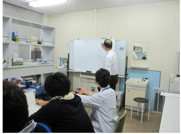
重要なところはしっかりメモ！