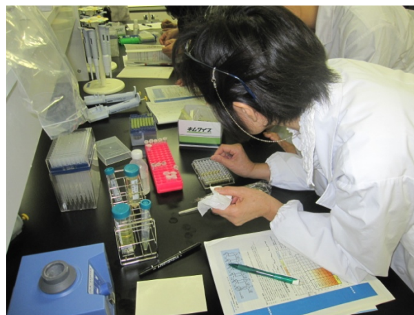
数値を正確に測るため 気泡をつぶします