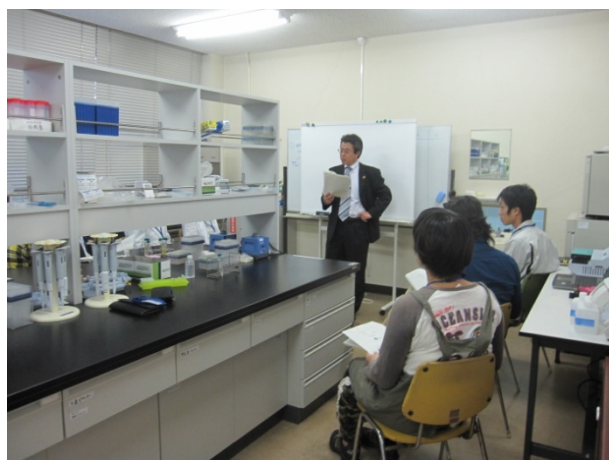
初めに測定の原理について学びます

今回は抗酸化能の評価法と、血圧上昇抑制作用の評価法を学びました。 96穴プレートや8連ピペッターなどを使用する細かい作業が続きましたが、最後の計算まで 順調に進めていくことが出来ました。