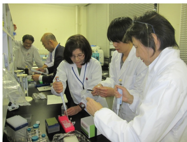
試料を希釈していきます