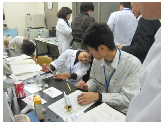
きちんと測定できたでしょうか？