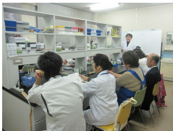
DNAについての講義を受けます