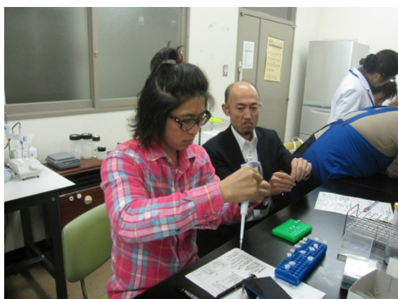
役割分担で作業効率アップ！