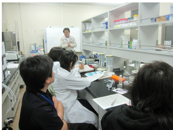
パックテストについて説明を受けます