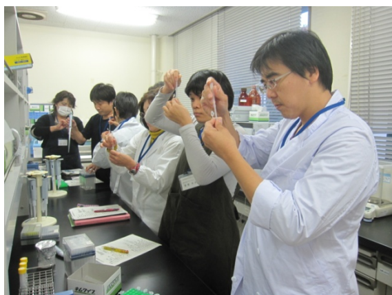
皆でコメを粉碎しています

第8～9回では遺伝子について学び、コメからDNAを取り出して、遺伝子判別を行いました。とてもデリケートな実験でしたが、どの班もきちんと結果を出すことができました。また、第9回では、簡易分析法についても学習しました。パックテストを用いて、身近な食品の硝酸やりん酸、水の硬度などを測定していきました。