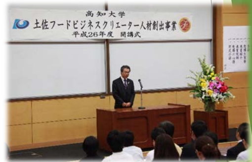
受田先生から力強い激励のお言葉をいただきました