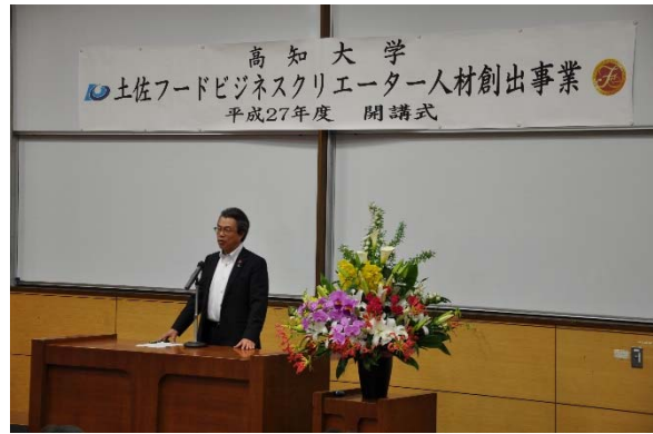
受田先生から力強い激励の お言葉をいただきました